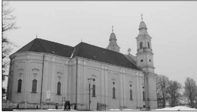
A csíksomlyói kegytemplom télen