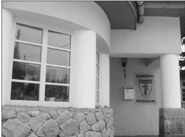
A Kós Károly által tervezett KALOT Ház