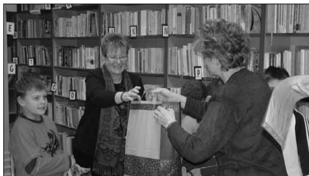
IPR csomagok átadása

valósítandó tevékenységekre kell fordítani (továbbképzés – hospitálás, szociális hátrányok enyhítése, partneri kapcsolatok erősítése, szaktanácsadás), a fennmaradó maximum 40%-ot nem kötelezően megvalósítandó tevékenységekre lehet fordítani (fejlesztő eszközök beszerzése, tanórai munkát segítő eszközök vásárlása, projektnap lebonyolítása stb). A pedagógusok kiegészítő illetményét az osztályfőnökök (24 fő) kapják meg, amely összege 940.800 Ft.