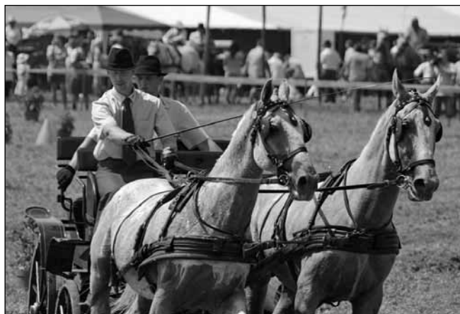
A szervezők, akik versenyeztek is

kettes fogatok versenyeztek, majd a négyes fogatok is. A szlovén vendégek „harci ruhában” bemutatóval és táncsal lepték meg az érdeklődőket. Az egri Mátyus Udvarház színvonalas bemutatóval kápráztatta el a közönséget. Az