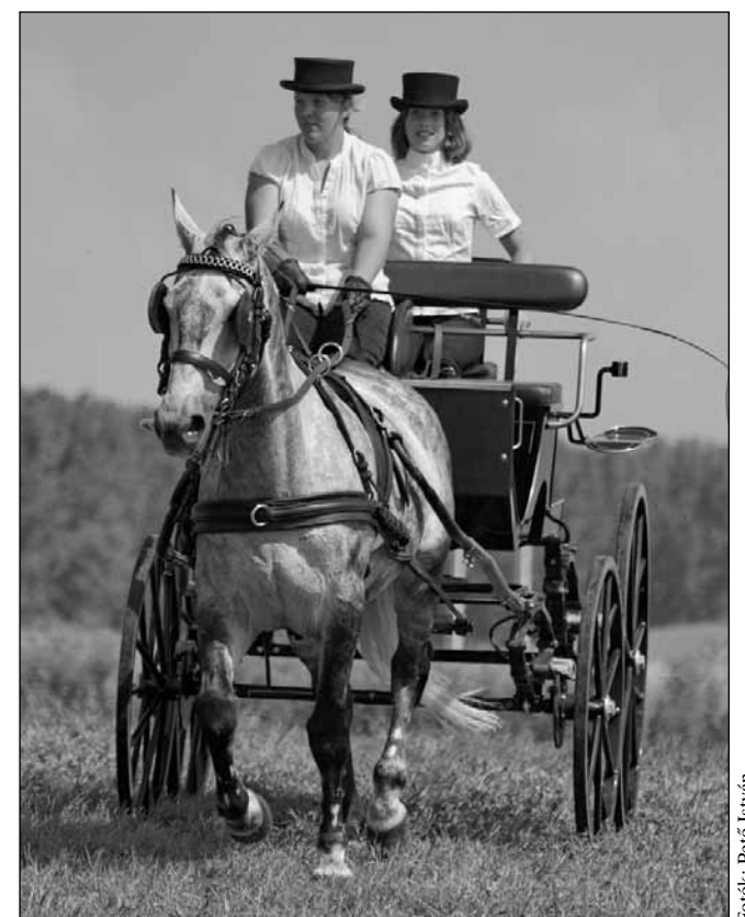
A lovassport nem csak a férfiaké!