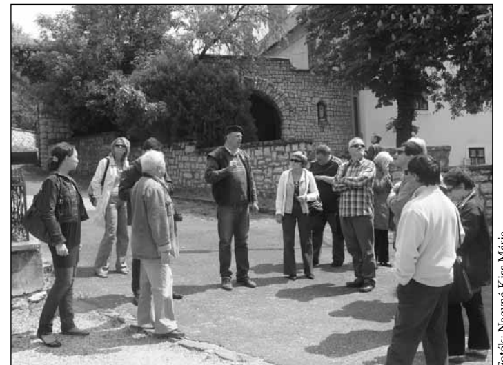
A Sümegi Püspöki Palota felújítása jó példája a kulturális Örökségvédelemnek

– A partnerek rendszeres cseréken és közös tervek kidolgozásán keresztül megerősítik európai hálózatukat.