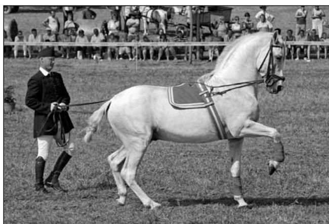
Az egri Mátyus Udvarház „táncoló” lova