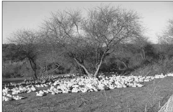
A régióra oly jellemző kacsatenyésztés

„Európai hálózat létrehozása a vidéki projekteket megvalósítókat támogatása céljából” – a címben definiált feladatot a három résztvevő szervezet: EPLEFA de Perigueux, Stowarzyszenie na Rzecz Rozwoju Region és a Jász Nagykun Szolnok Megyei Népfőiskolai Társaság munkatársai járták körbe.