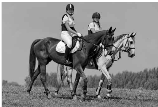
Az ifjú díjugrató nemzedék

kettes fogatok versenyeztek, majd a négyes fogatok is. A szlovén vendégek „harci ruhában” bemutatóval és táncsal lepték meg az érdeklődőket. Az egri Mátyus Udvarház színvonalas bemutatóval kápráztatta el a közönséget. Az