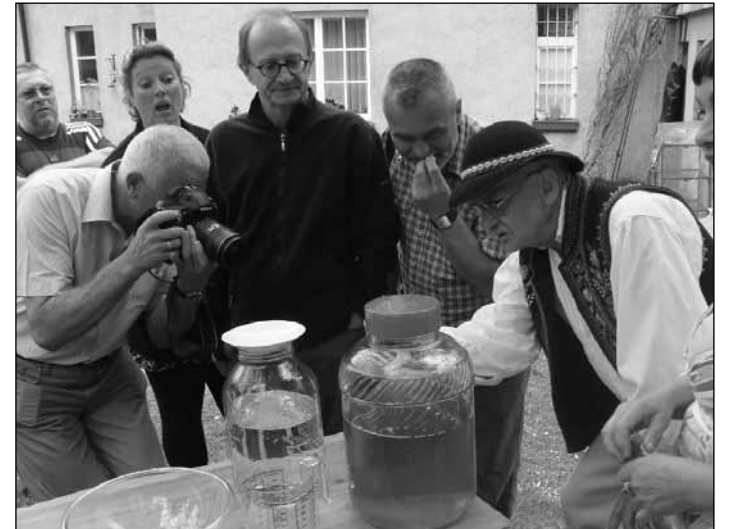
A gyógynövényből készül az ital, ami a vendégek asztalára kerül

Milyen pedagógiai módszerekre, eszközökre van szükség a projektek megvalósításának támogatása során.