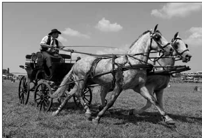
A jászgói Csajkás család gazdaságának büszkeségei

egri vártól 2 km-re az Eged-hegy lábánál Eger és Noszvaj között található a Mátyus Udvarház Lipicai Lovastanyája, ahol vendéglő és panzió áll vendégeink rendelkezésére – a tulajdonos lipicai lovak tenyésztésével és lovas szolgáltatások biztosításával foglalkozik. Lovas-oktatást már kezdő szinttől igénybe lehet venni, a jó szinten lovag-