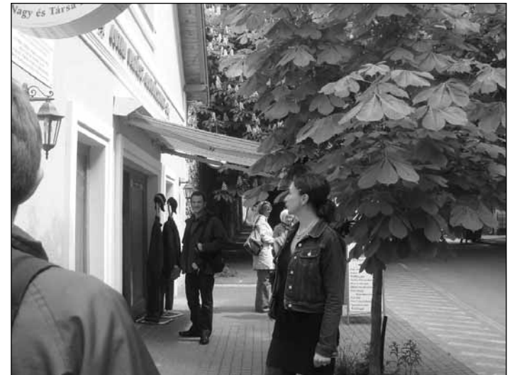
A csoport Sümegen LEADER támogatással létrehozott Vadászbolt előtt