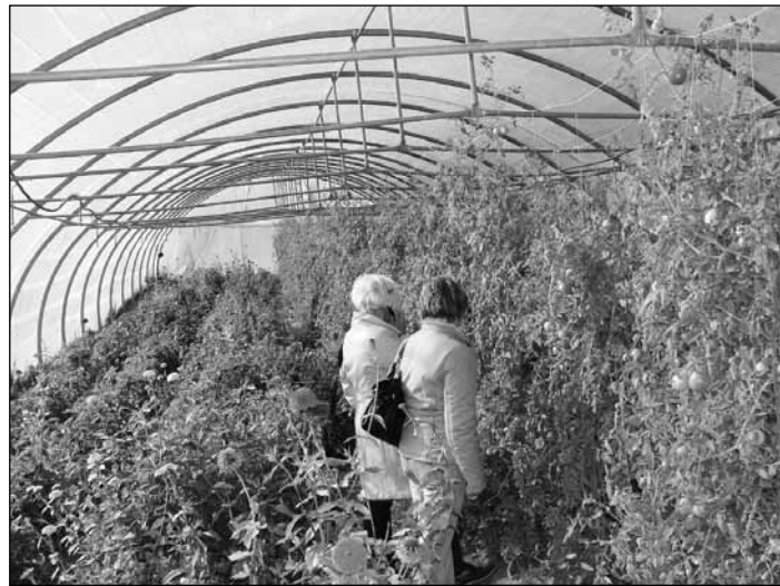
Fólia alatti támrendszeres paradicsomtermesztés

Többszöri találkozók, tapasztalatcserék és helyszíni demonstrációk révén sikerült eredményesen lezárni a GRUNDTVIG PARTNERSÉG A KÉPZÉSBEN program égisze alatt lebonyolított két éves projektet.