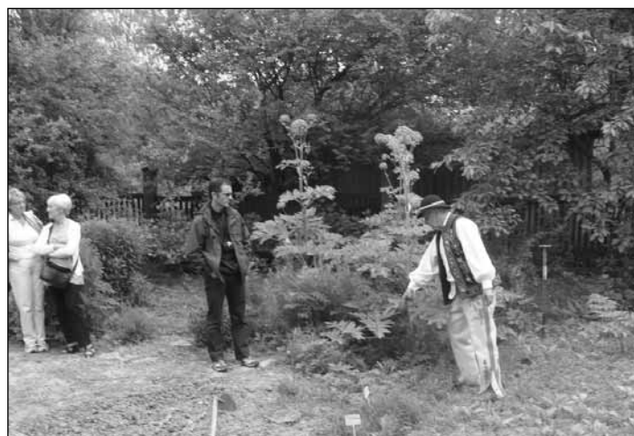
Látogatás egy dél-lengyelországi gyógynövénykertben

Különböző projektek, azok támogatásának menedzselésének bemutatása minden partner részéről.