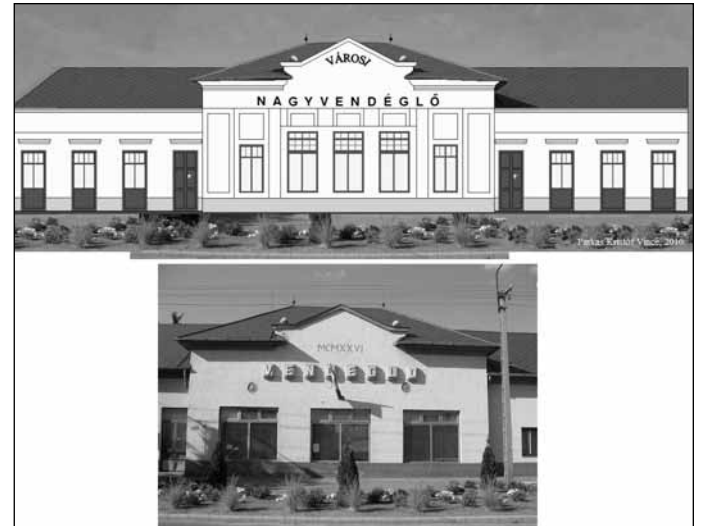
Farkas Kristóf Vince rajza a régi kaszinóról

város megújulása érdekében – sok helyen jó szándékkal – megkezdett munka városromboló folyamatokat indított el. A nagy múltú városi terek felújítása egyre inkább az adott városi terek jellegét megváltoztató reprezentációs igények kielégítését szolgálja! A túlbujánzó fantázia historikus