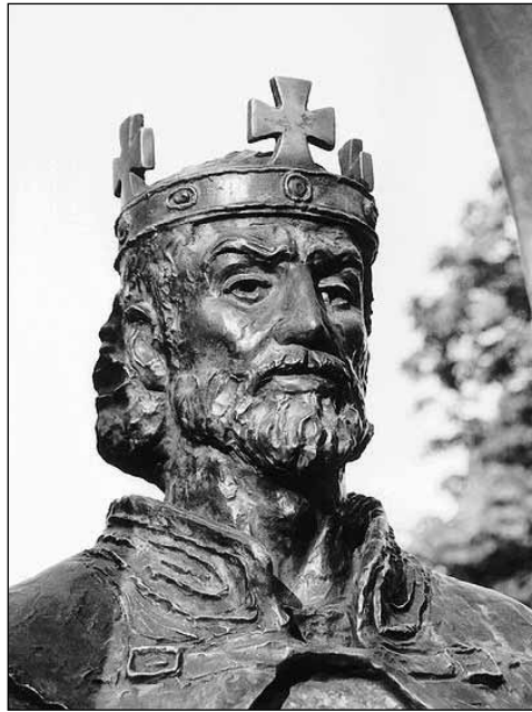
Szt. István alakja Esztergomban, a Széchenyi téri Szentháromság-szobron

A Szent Korona noha a legfőbb királyi jelvény, a korona általában mindenütt nagy tiszteletben részesült, az a fajta szentség és közjogi méltóság, amit a magyar nemzet tulajdonított a Szent Koronának, másutt ismeretlen volt. A megkülönböztetett tisztelet okai közt első helyen szokás emlegetni, hogy a hagyomány Szent István koronájával azonosította, sőt sokáig még a koronakutatók is úgy hitték, hogy a koronának legalább a felső része Istváné lett