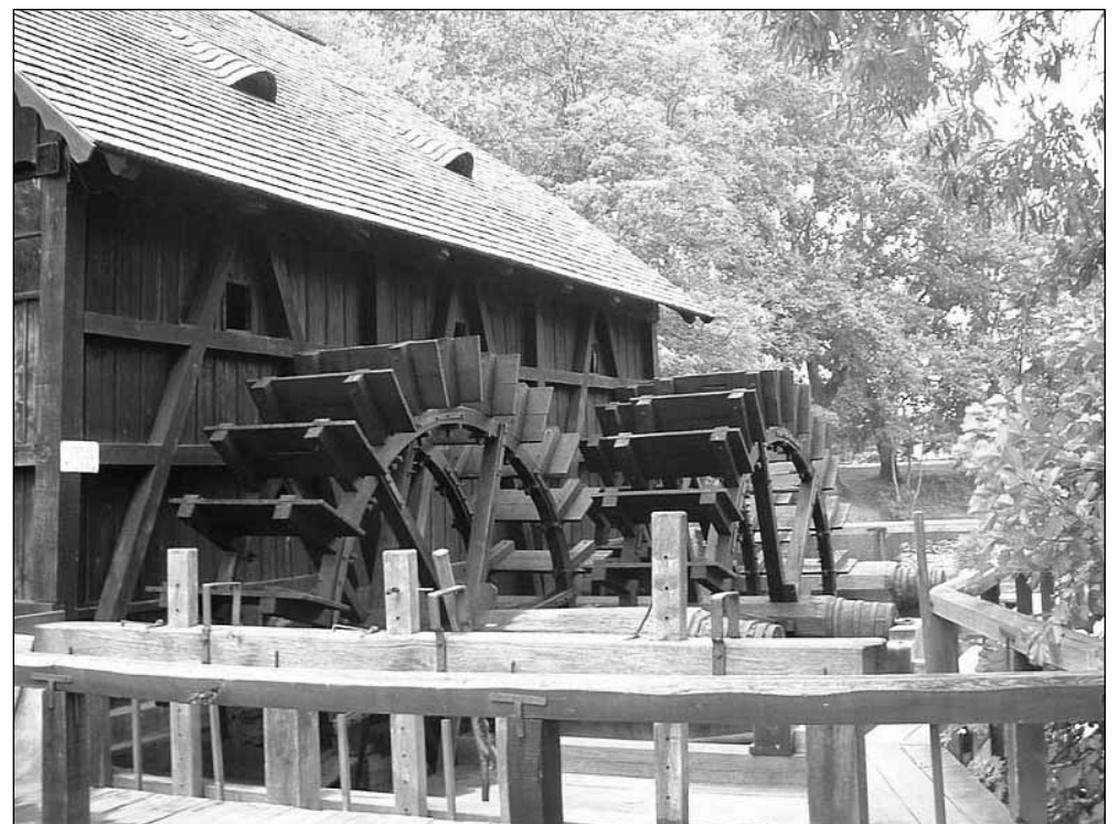
Túrístvándi büszkesége az ipartörténeti szempontból egyedülálló vízimalom. Már 1315-ben a Kende féle levéltári anyagok is megemlítik létezését Istvándiban, de a jelenleg is működőképes malom őseit a Mária Terézia korából való 1752-es levéltári anyagokhoz kötik.

Éppen ezért az önkormányzat az érdeklődő családokkal hamarosan szerződést köt, és közösen pályáznak majd helyi hús- és térspecialitásokat bemutató helyek kialakítására . Aki pedig nem akar otthon bajlódni a vevőkkel, azoknak ott lesz a piac , amit jövőre szeretnének átadni. Az önkormányzat tulajdonában maradó árusítóhelyet a helyi Szatmári Szociális Szövetkezet működteti majd. A szövetkezetet jó egy éve tizenhárom munkanélküli hozta létre az önkormányzat bábkodásával, s már az eddig eltelt hónapok is azt mutatják, találnak maguknak munkát. Egyik legéleterevalóbb kezdeményezésük a háztartás-gazdálkodási szolgáltatás. A falusi portá-