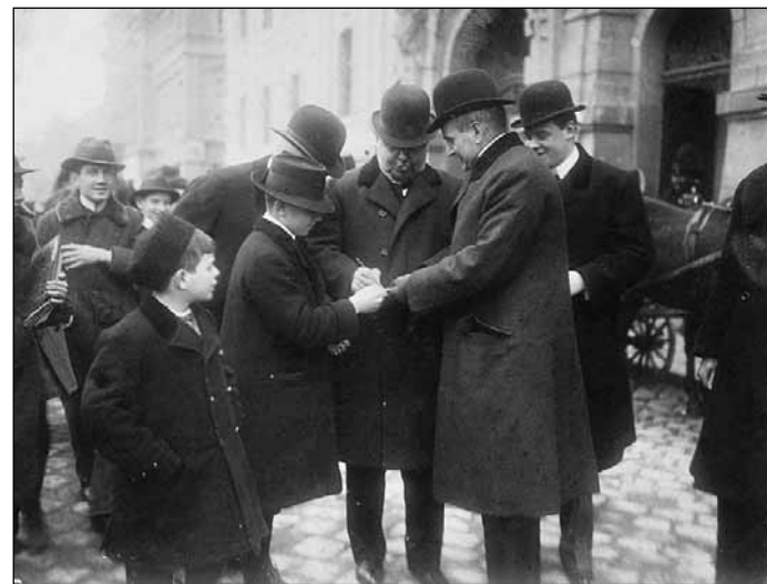
Mikszáth Kálmán Szegeden autogramot ad

A kismesség és a parasztság határvilágából indult. A családban nemesi nagy múlt legendái éltek, de a gyermekkor környezete a palóc és szlovák parasztság volt. Lelke egészével, finom költői hangulatokkal szereti és rajzolja világlátésében a paraszti alakokat, nemegyszer idilli, máskor balladai fényben. De magamagát otthon a dzsentrivilágban érzi, és ennek a dzsentrivilágnak senki sem látja oly világosan hibáit, társadalmi parazita voltát, mint ő.