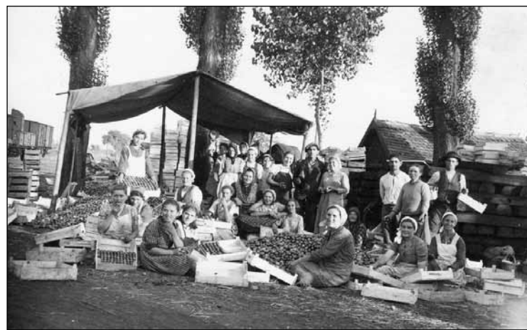
Egy kép 1938-ból... Jászfényszaru már ekkor is híres volt zöldségtermesztéséről. A képen láthatjuk, hogyan készítik elő külföldi szállításra a félférett Lucullus paradicsomot.

A Szent Iván napi tűznek egészségvarázsló szerepe is volt, közvetlenül a tűz átugrálása, valamint a felette füstölt különféle növények révén. Pl.: Gimesen virágos bodzafa ágat pároltak a tűzön és később daganatra tették. Tardoskedden a tűzön megpörkölt bodzát az ágyba vitték bolhák ellen. Vajkán vasfüvet, fodormentát, tisztesfüvet füstöltek, ebből főztek teát „mellfájás” ellen. A tűzbe gyümölcsöt dobáltak, hogy az elhalt gyermeket gyümölcsökhöz juttassák.