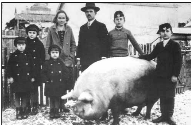
Kun család és a Juca disznó, 1938 – Kiskunfélegyháza

egész napi munkában a háziasszonynak segítettek a szomszédasszonyok, s a közeli rokonok. Ez a segítség kölcsönös volt: a háziasszony később visszasegített, ha a szomszédoknál volt disznóölés. Ebédre orjalevest és paprikás húst főztek az asszonyok, de ekkor nem sokat időztek az evéssel, mert még sok munka várt rájuk. Kora délután hozzálátottak a vacsora készítéséhez. A nap fénypontja a disznótor volt, amelyre nemcsak azokat hívták meg, akik egész nap segítettek, hanem másokat is, elsősorban a közeli rokonság köréből, a szomszédokat és a jó barátokat. A disznótorra a böllér hívta meg a vendégeket úgy, mintha virrasztóba hívná őket. Elmondta tettetett szomorúsággal, hogy „szegény öreg befejezte”, s hogy „mostanában már nem evett, legutóljára is mennyit hörgött”, s csak a legvégén árulta el véletlen szóval, hogy milyen virrasztóba is hívogat.