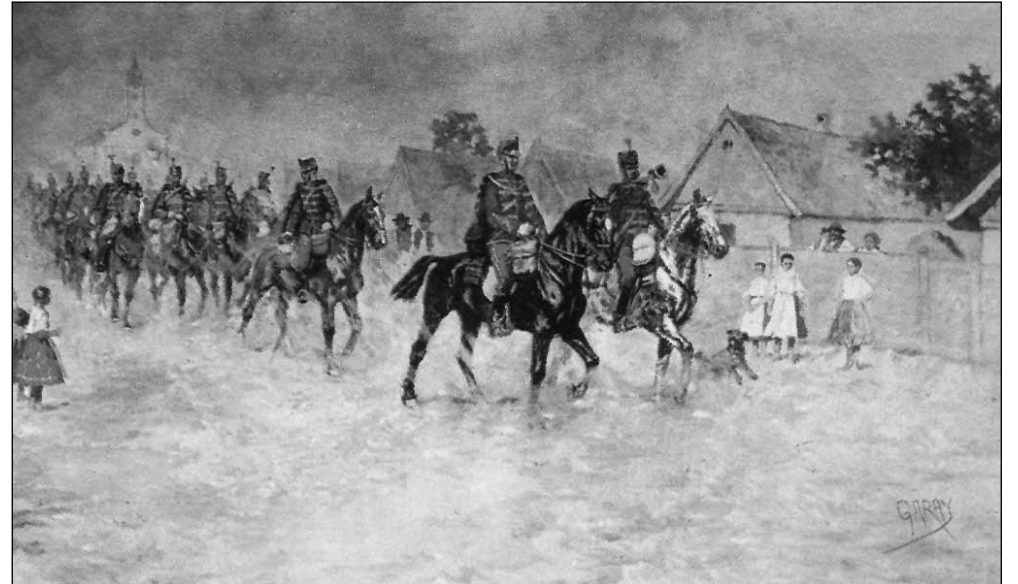
A 13. Jászkun huszárezred átvonul Bonyhádon a XIX. század végén (Garay Ákos festménye)

lett egyesült Pulz ezredes lovasdandárával, ám mielőtt csatlakoztak volna a dandárral, Medolánál menetből kergettek szét egy lancieri (ulánus) ezredet. A königrätzi katasztrófa hatására a császári hadvezetés Észak-Itáliából kívánt csapatokat az „észa-