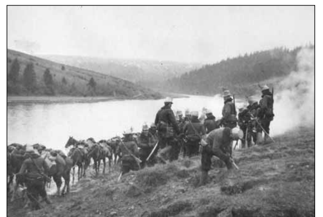
Jászkun-huszárok 1914 tavaszán

Az ezred állomáshelye az I. világháború kitöréséig több ízben változott: Brzezany (1866), Székesfehérvár (1871), Temesvár (1874), Budapest (1886), Kecskemét (1893), Jaroslau (1904), Lancut (1906), Székesfehérvár (1912). 1882-ben a dalmáciai lázongás időszakában a 13-asok 5. századát rendfenntartási teendőik ellátása végett Dalmáciába vezényelték, 1912-ben a balkáni válság miatt hadilétszámra emelték az ezredet.