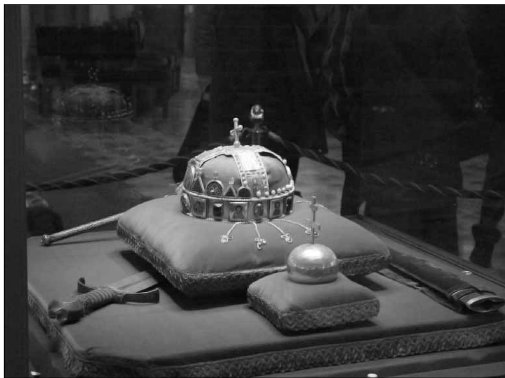
A koronázási ékszerek a Parlamentben

király miatt az országban polgárháború tört ki. A csatából Ulászló került ki győztesen. 1463-ban Mátyás király Bécsből vásárolta vissza a koronát 80 000 aranyforintért. A mohácsi csata után Habsburg Mária Bécsbe menekítette I. Ferdinándhoz. Koronázását 1527. november 3-án tartották. Ez volt az utolsó székesfehérvári királykoronázás.