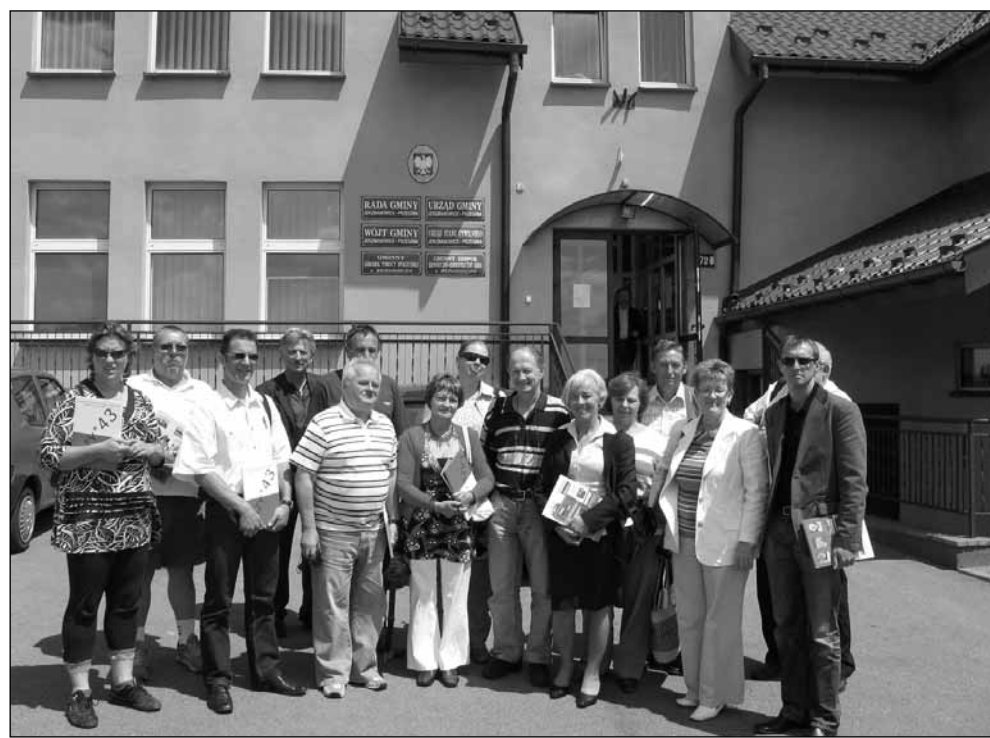
Csoportkép a Jerzmanowice-i középiskola látogatásakor – francia, lengyel és magyar delgációk tagjai

2009. június 16–21. között a hálózat résztvevői ismét találkoztak a lengyelországi Sucha Beskidzkán, ahol gazdag programnak lehettünk mi is részesei. Az Ökoló-